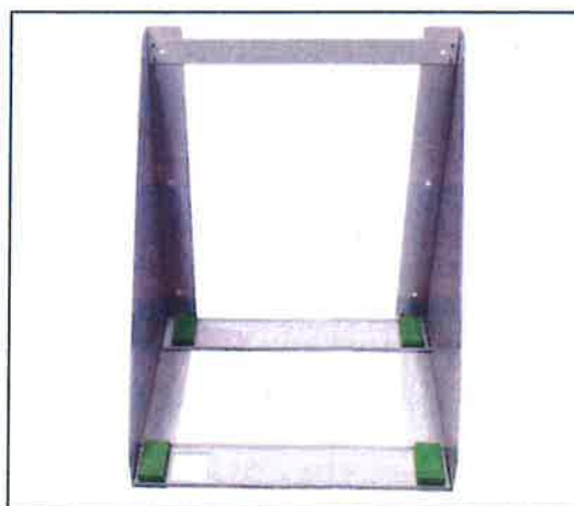
Til sidst placeres de 4 sylomerer i hvert hjørne.