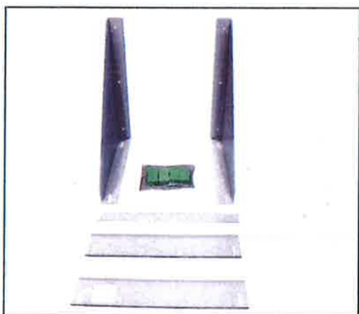
Indhold: 2 sidestykker og 3 stk. beslag. Pose med 4 stk. sylomerer og 12 nitter til ø5 mm huller.