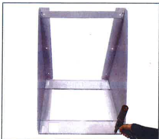
Bundbeslagene placeres på sidestykkerne, så hullerne er over hinanden og med kantsiden op. Forreste beslag skal placeres så udstandsningen til afløb (på Combi S Polar Top) er placeret til venstre. Beslaget nittes sammen med sidestykkerne fra oversiden.