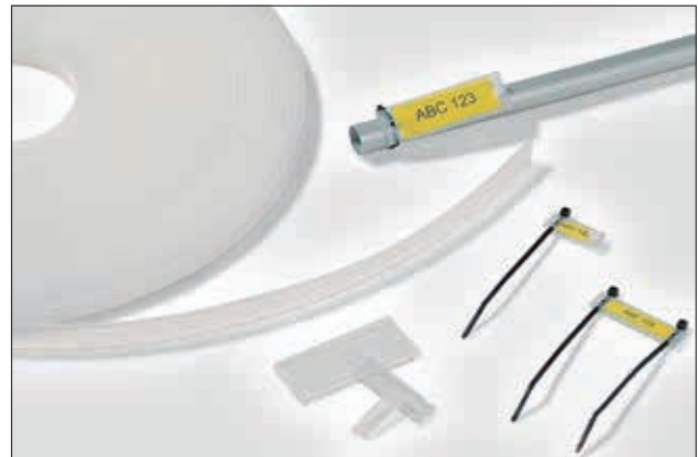
Helafix HC/HCR giver en multifunktionel opmærkning.